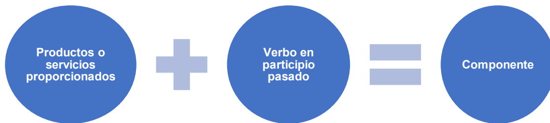
Figura 1 Sintaxis de los Componentes.